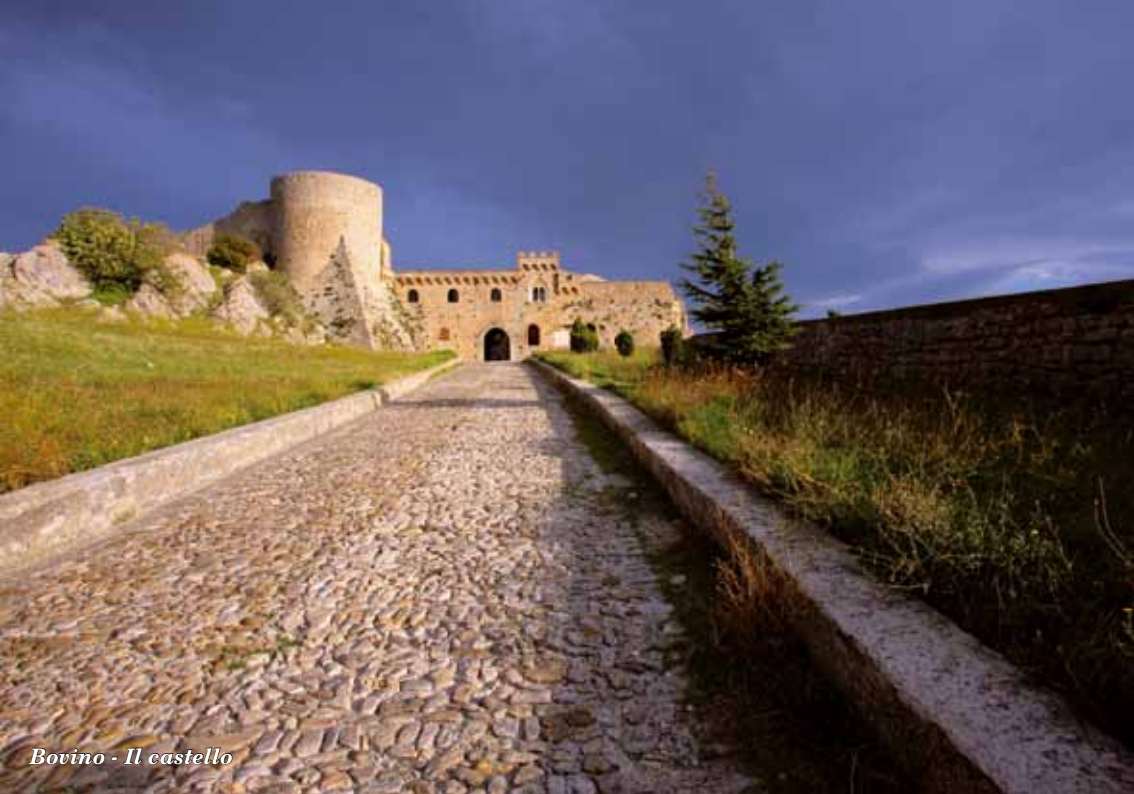
Bovino - Il castello

L'EDITRICE ROTAS , oltre a dedicarsi alla pubblicazione di libri di storia della nostra regione, è rivolta anche al mondo della Chiesa, alla diffusione di testi sulla “Memoria” e di letteratura per bambini e ragazzi. Tra le sue collane: Puer Apuliae , su Federico II di Svevia; Sic et Non , collana di studi e ricerche, in coedizione con l'Istituto Superiore di Scienze Religiose di Trani; I Quaderni dell'archivio , in collaborazione con l'Archivio della Resistenza e della Memoria di Barletta; Piccolo Scaffale ; Paraboleggiamo e Impronte .