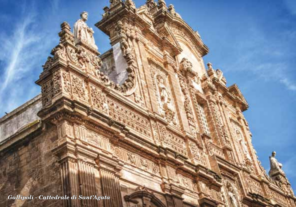
Gallipoli - Cattedrale di Sant'Agata

ZANE EDITRICE nasce nel 1989, dedicandosi alla tradizione culturale salentina. Nel 2006 alla Collana “Slavica”, che raccoglie opere di memorialistica dei paesi slavi, si aggiunge la Collana “Inchiostrobianco”, dedicata alla scrittura delle donne. Nel 2010 si rivolge uno sguardo al Mediterraneo, con il Festival “Lo Sguardo Di Omero”, dedicato alla narrazione cinematografica d'autore e al documentario per raccontare le civiltà dell'Europa e del Mediterraneo nelle loro trasformazioni. Seguono le Collane “Letterature Popolari” e “Penne Sciolte”; “Salento crocevia”; “Il mestiere del narrare”.