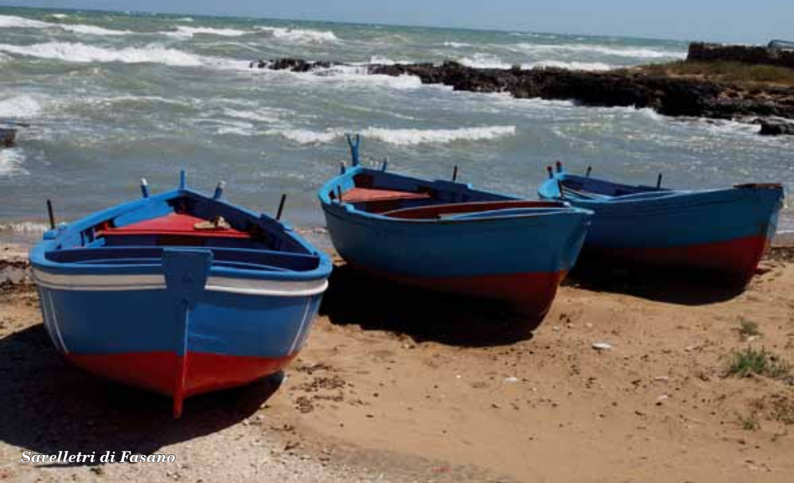
Savelletri di Fasano

SCHENA EDITORE è presente sul territorio, con la sua produzione libraria, sin dagli anni '70. Privilegia la pubblicazione di libri di argomento pugliese, dando voce ad autori locali e non, che trattano di Storia, Archeologia, Arte, Saggistica. Rivolge sempre maggiore attenzione alla Narrativa, Poesia, alla Filosofia, alla Psicologia. Non di meno l'interesse della casa editrice si riversa nell'ambito scientifico, con pubblicazioni realizzate in collaborazione con varie Università, italiane e straniere.