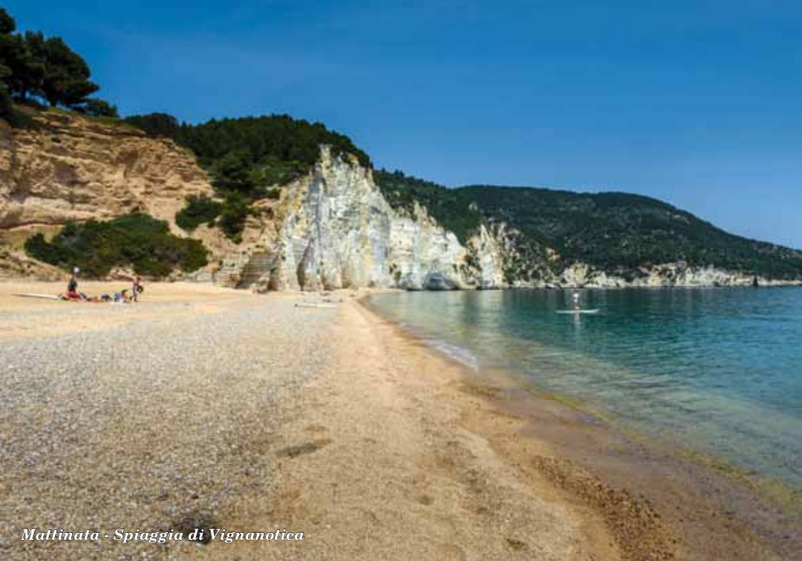
Mattinata - Spiaggia di Vignanotica