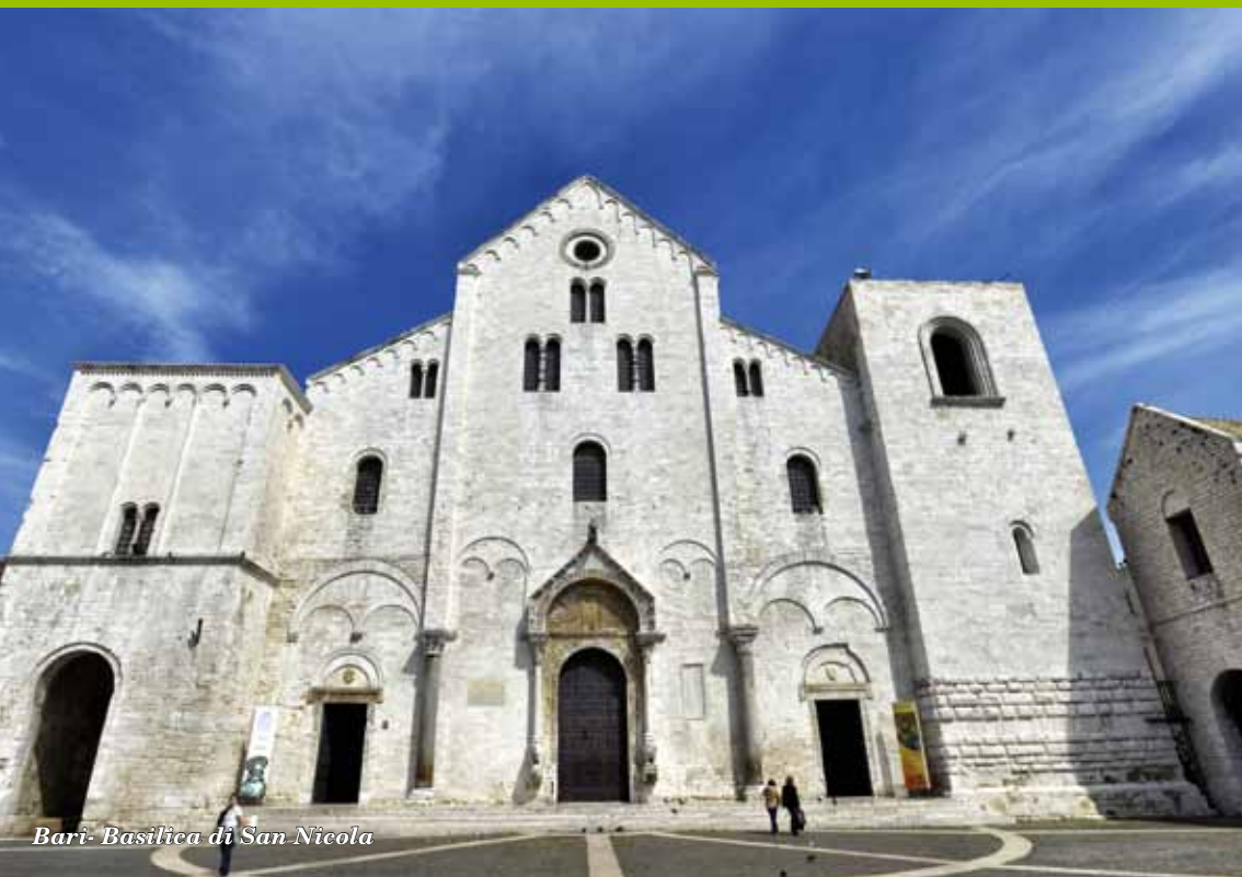
Bari- Basilica di San Nicola

Settori di produzione: Archeologia, Arte, Beni culturali, Scolastico, Storia, Turismo.