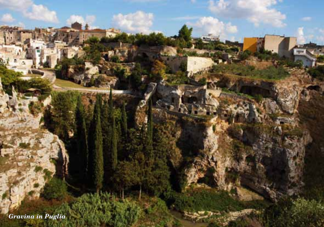
Gravina in Puglia

IL GRILLO EDITORE nasce nel 2004 a Gravina in Puglia con l'intento di avviare un percorso di ricerca orientato verso le incantevoli terre dell'intero Mezzogiorno d'Italia. Il piano editoriale oggi si è ampliato con nuove collane: Lorodipuglia , autori pugliesi che raccontano la propria terra; Indizi , gialli, noir e thriller; Lampioni , piccoli libretti dalle grandi storie; Ristretti , una varietà narrativa in poche migliaia di battute; Raminghi , una nuova proposta per chi viaggia e vuole scoprire e conoscere il mondo; Euterpe , la collana della musica, arte per eccellenza.