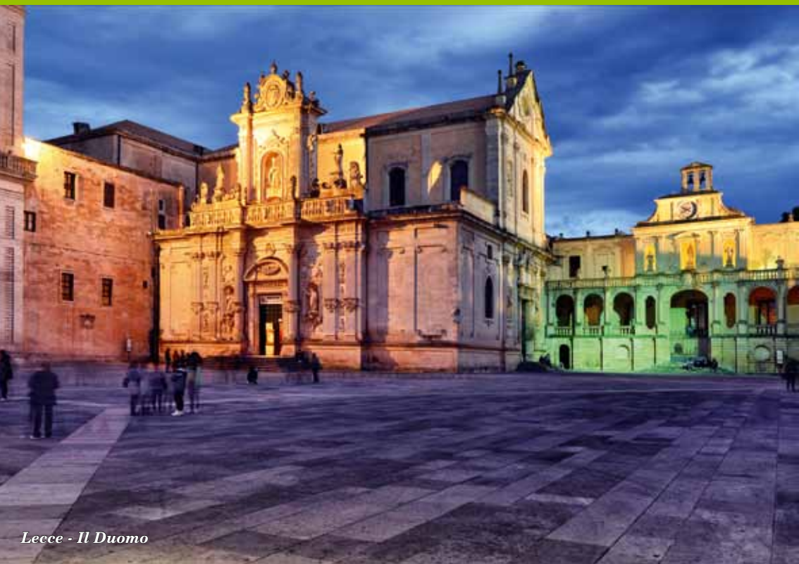
Lecce - Il Duomo

Settori di produzione: Letteratura del mondo - Saggistica.