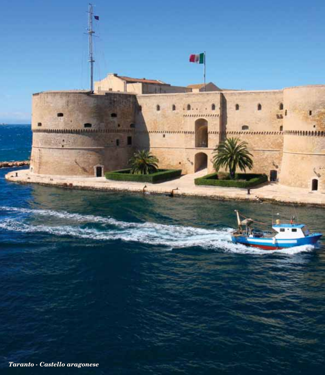
Taranto - Castello aragonese