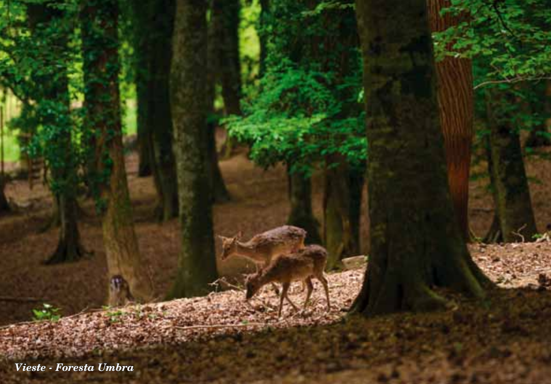
Vieste - Foresta Umbra

La CASA EDITRICE MAMMEONLINE è stata fondata nel 2003 per promuovere e valorizzare le capacità artistiche, intellettuali e creative delle donne e diffondere la conoscenza su infertilità e procreazione assistita, adozioni, maternità e genitorialità. Si è incrementata la produzione di libri per bambini, con l'obiettivo di spiegare temi quali l'ingresso in famiglia tramite l'adozione, la nascita e la procreazione assistita, i disturbi dell'apprendimento, l'amicizia, gli affetti familiari, la diversità, la tolleranza, i desideri e le aspettative. Importanti i testi che aiutano a gestire le emozioni e ad affrontare temi difficili, come quello degli abusi sessuali.