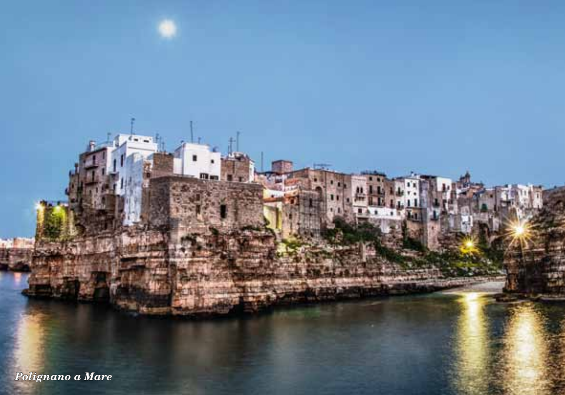
Polignano a Mare

STILO EDITRICE è stata fondata nel 1999. Il suo lavoro si distingue per la capacità di coniugare il rigore scientifico all'eleganza grafica, la ricerca di contributi creativi all'attenzione ai classici e alla fedeltà al territorio. I suoi volumi provengono dal mondo della ricerca, dal settore del volontariato, dall'ampio e variegato bacino della narrativa, e sono caratterizzati da una grande cura formale e dalla profondità dei contenuti.