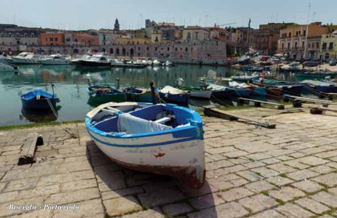
Bisceglie - Porticiuolo

CACUCCI EDITORE è stata fondata nel gennaio 1929 ed è tra le più antiche case editrici del Meridione. È tradizionalmente nota come editrice universitaria legata alle pubblicazioni giuridiche, economiche e sociali. È stata tra le prime del settore a intraprendere la strada dell'informatica, fino ad arrivare a internet, con un sito e il proprio database per meglio dialogare con il mondo dell'editoria. Questo ha consentito di mantenere una struttura snella ma capace di garantire una crescita costante.