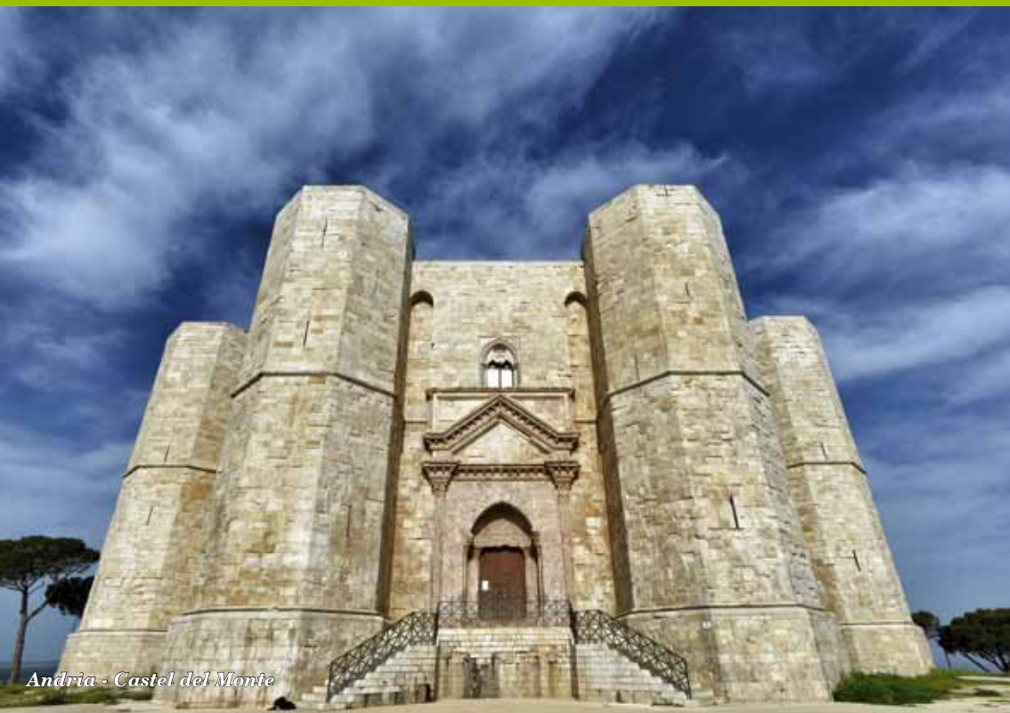
Andria - Castel del Monte

Settori di produzione: Poesia, Narrativa, Letteratura per l'Infanzia, Saggistica, Teatro, Didattica.