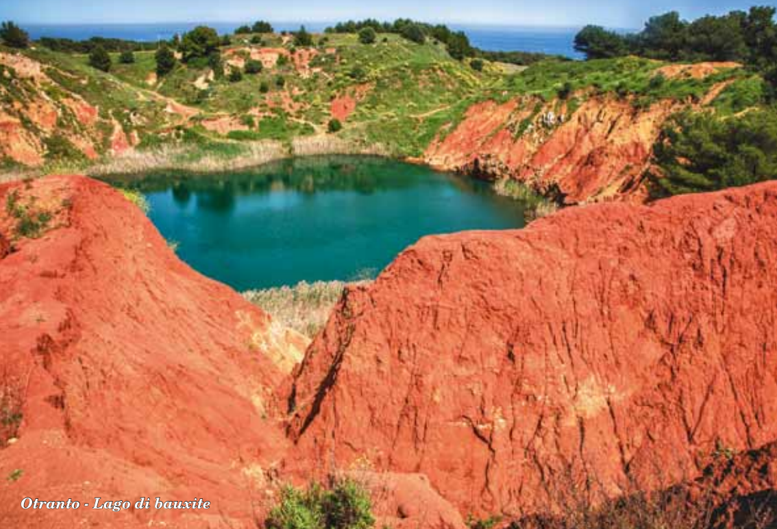
Otranto - Lago di bauxite

Settori di produzione: Saggistica (Documentaristica/audio e video), Narrativa, Poesia.