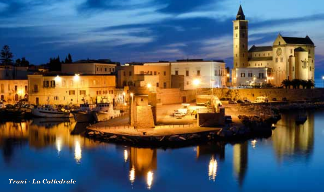
Trani - La Cattedrale

Settori di produzione: Saggistica (con particolare attenzione all'Università italiana), Narrativa, Poesia.