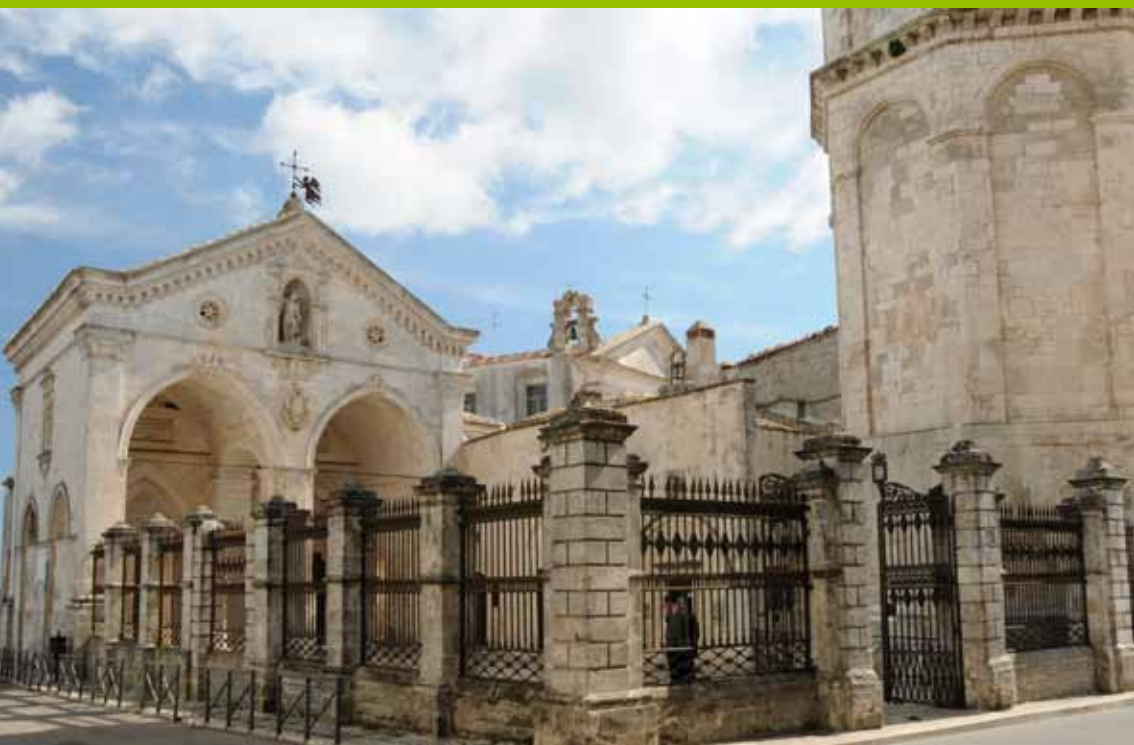
Monte Sant'Angelo - Santuario di San Michele Arcangelo

Settori di produzione: Ambiente, Archeologia, Architettura, Arte, Genti e Territorio, Storia, Guide e Cartografia turistica.