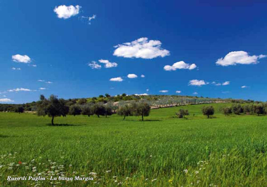
Ruvo di Puglia - La bassa Murgia

PROGEDIT , fondata nel 1997, si è connotata per la sua impronta progettuale e per una forte professionalità editoriale. Ne sono emblema il logo – un calamaio che mette radici e dal quale sbocciano foglie – e l’acronimo che dà il nome alla casa – mettendo insieme le iniziali di ‘Progetti’ e di ‘Editoriali’. Le numerose collane hanno ampliato progressivamente l’orizzonte partendo dal mondo della ricerca e della formazione per legarsi sempre più al territorio e alle risorse culturali e ambientali.