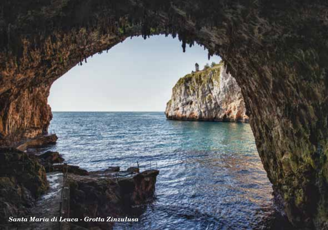
Santa Maria di Leuca - Grotta Zinzulusa

MANNI EDITORI nel 1985 pubblica il primo libro.