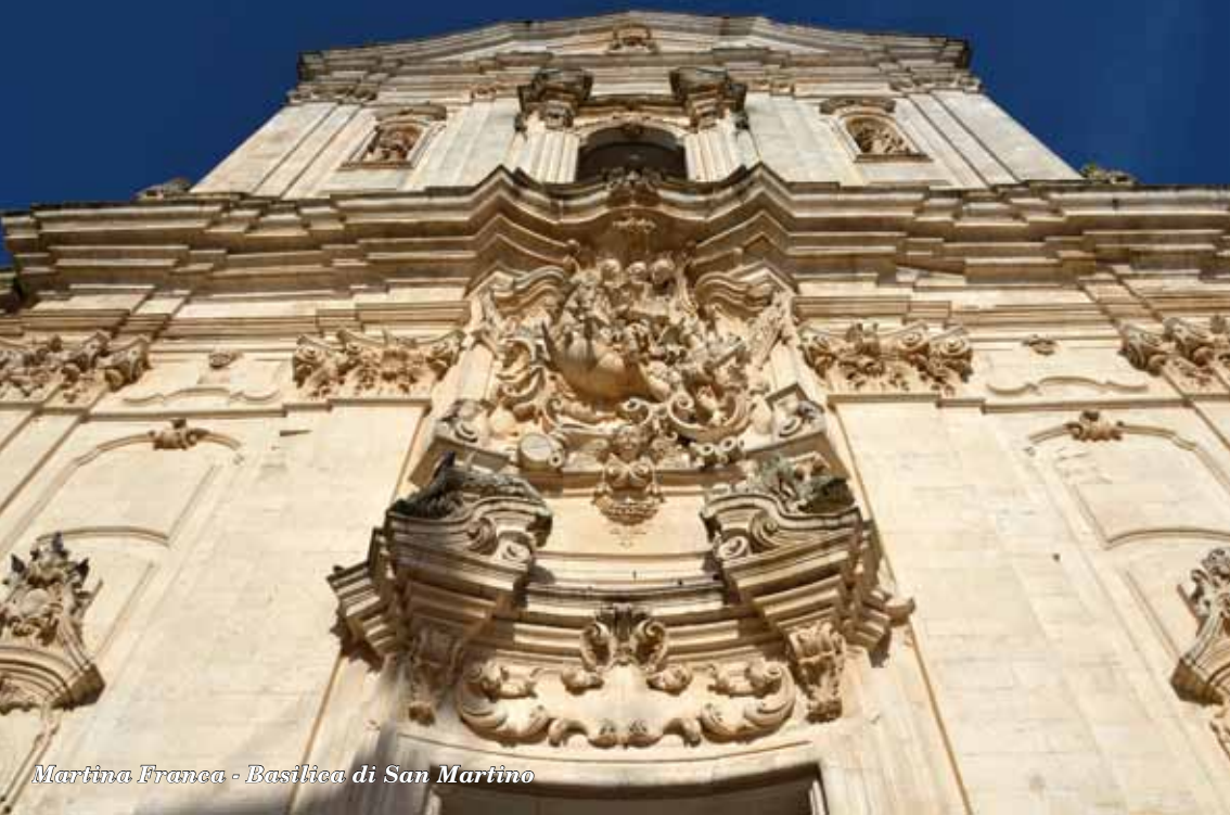
Martina Franca - Basilica di San Martino

FALVISION EDITORE viene fondata nel 2009. È specializzata in editoria Braille, Large Print, LIS-Sign Writing, DSA, Pittografia, Allestimenti Tattili per Musei, Parchi naturali ed Enti in genere, arte in tecnica puntinata e micro-capsule. Ha diverse collane 'nero/braille' tra cui spiccano la Collana di saggistica [zu:m] – riscoprire la storia, la Collana di arabistica I volti e le tracce e la nuova Collana di studi sociali, antropologia, pedagogia e scienze dell'educazione Ars Educandi.